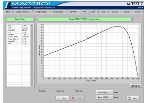
Fig.1 : M-TEST 7 电机测试软件

在电机测试过程中，可以读取并监视多达 128 个热电偶或者模拟量传感器。可以完成电机的轴承、绕组和外壳的温升曲线，并且可以测量用气动工具或者内燃机的气流/排气效率。通过与测功机控制配合使用，M-TEST 7 甚至可以在执行工作循环和寿命测试负载模拟时进行传感器测量。