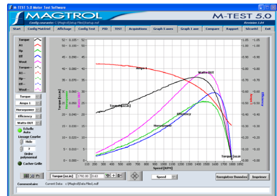
M-TEST 5.0 Affichage graphique des mesures