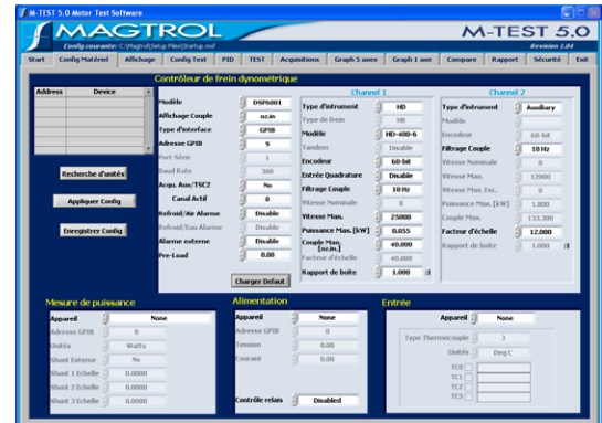
M-TEST 5.0 Fenêtre de configuration hardware